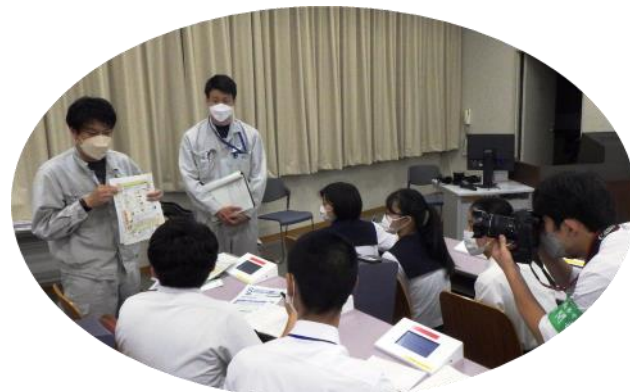
取材の様子 生徒の真剣な眼差しが印象的でした

この中の5つの班・約50名が8月2日(火)の午後に新江東清掃工場を訪れました。約1時間30分という限られた時間でしたが、清掃事業についての説明を受けた後に中央制御室などを見学しました。その後、前日に班で考えた質問に基づき、熱心な取材活動を行いました。