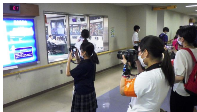
▶ 中央制御室を見学

文化部のインターハイと呼ばれる第46回全国高等学校総合文化祭東京大会が、7月31日(日)～8月4日(木)に実施されました。新聞部門は、生徒など約500名が48班・11コースに分かれて、都内各地で取材した交流新聞の作成を行いました。