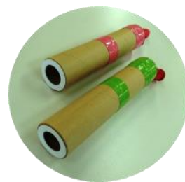
空気砲の 工作キット (完成品)

当工場のブースでは、工場を紹介したパネル展示のほかに、持込みごみの受付で発行するごみ受付伝票の紙芯を利用して作製した空気砲の工作キットを配布しました。工場に対する質問も多く寄せられ、親子連れの方など、約300名の区民の方々に楽しみながら参加していただきました。