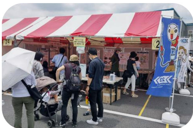
新江東清掃工場の出展ブースの様子

6月5日(日)、えこつくる江東で開催された第15回江東区環境フェアに3年振りに参加しました。