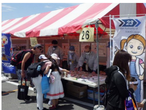
出展ブースの様子

ごみの受付伝票の紙芯を利用した工作キットを配布しました。工場に対する質問も多く寄せられ、約450の方に楽しみながら参加していただきました。