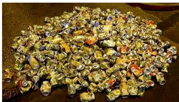
搬入物検査で出てきた不適正ごみ（空き缶）