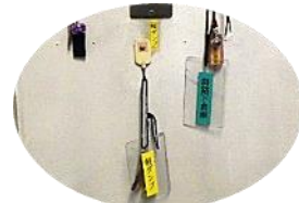
キーホルダーの名札

当工場は、大気汚染防止法の基準値より厳しい自己規制値の設定や雨水の再利用など、環境に配慮した操業を行っています。