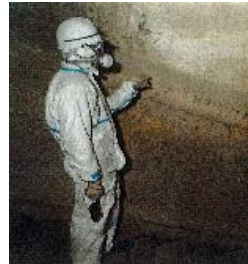
〈 焼却炉内部 炉壁確認 〉

このように、焼却炉の毎年の点検と整備を確実に実施することで、安全で安定した工場運営に努めています。