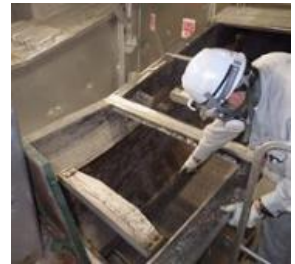
〈 灰コンベヤ 内部確認 〉