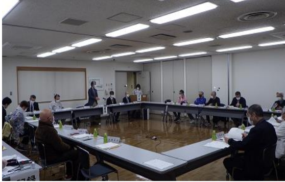
第26回運営協議会の様子

令和5年3月16日(木)に当工場会議室において、第26回運営協議会を開催しました。運営協議会は、地域住民代表委員・墨田区委員・東京二十三区清掃一部事務組合委員で構成され、年に1回開催しています。