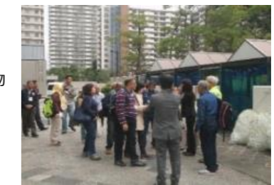
研修生の受入れの様子