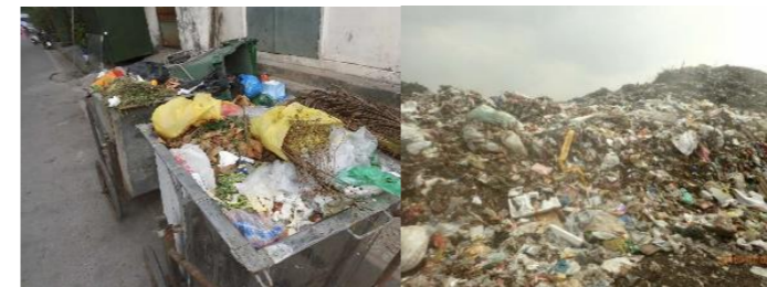
途上国での廃棄物処理の様子

また、近年のSDGsなどの国際的潮流の中では、一人ひとりが持続可能な開発目標のために行動を起こしていくことが求められています。今後は、本アクションプログラムに基づき、さらに23区や関係機関との連携・協力を図りながら、海外諸都市の課題解決に貢献してまいります。