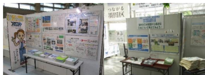
区主催イベントでの展示の様子