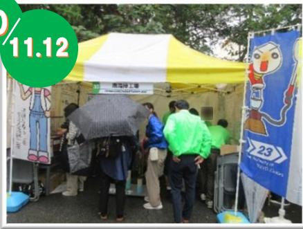
みなと区民まつり