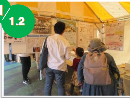
渋谷区くみんの広場 ふるさと渋谷フェスティバル