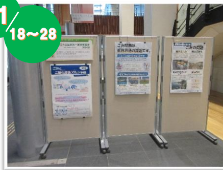
みんなと3R パネル展（港区）

各イベントでは、食品ロス・衣服の大量廃棄などの世界のごみ問題を取り上げたパネルの展示、環境啓発を目的とした謎解きゲームやアンケートを実施しました。