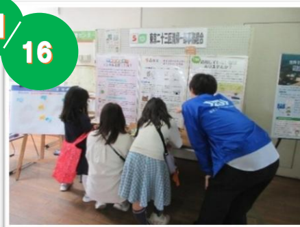
エコまつり・めぐろ