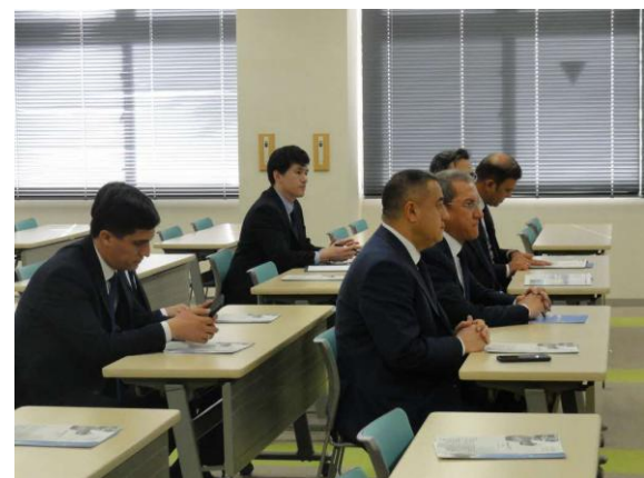
ウズベキスタン共和国ホレズム州知事・駐日大使 (11月12日(水) 世田谷清掃工場)