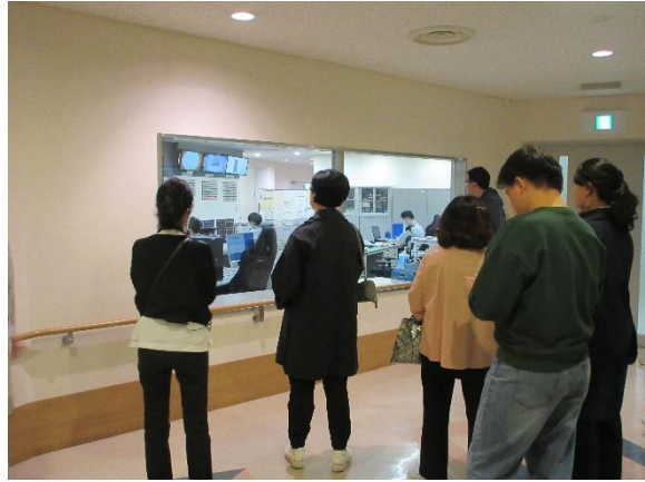
大韓民国ソウル特別市議会代表団 (10月22日(水) 渋谷清掃工場)