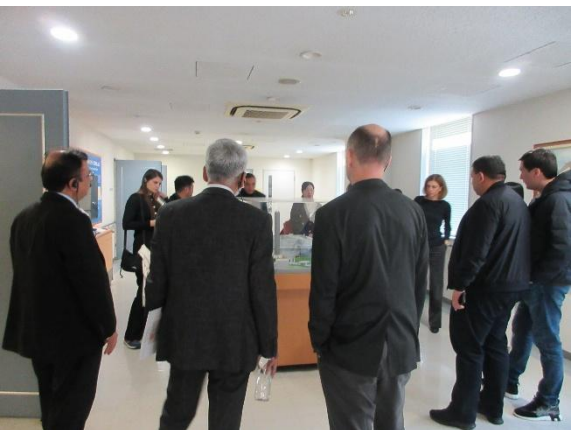
世界銀行（多国籍政府関係者） (11月28日(金) 品川清掃工場)