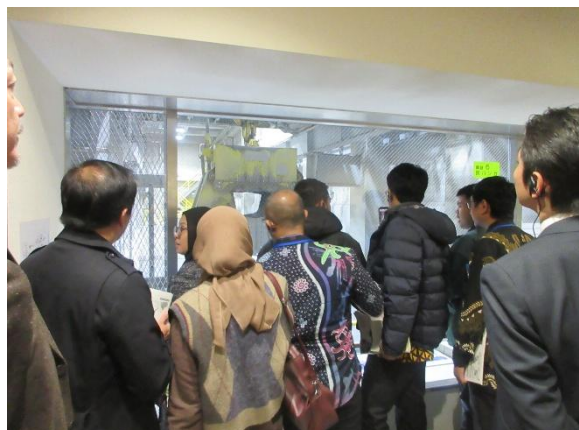
JICA 新首都圏3都市開発計画策定 プロジェクト研修生（インドネシア共和国） (12月12日(金) 墨田清掃工場)