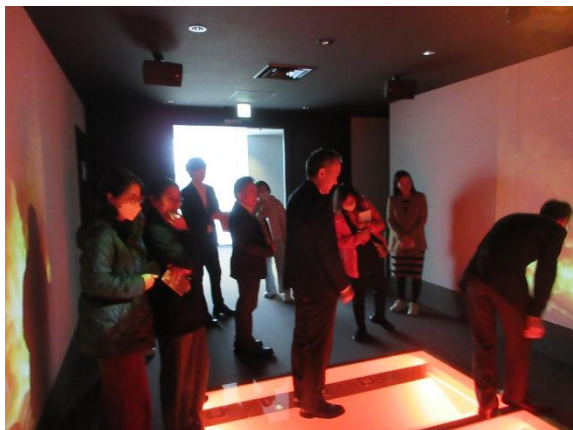
循環産業研修研修生（ベトナム社会主義共和国） (11月11日(火) 目黒清掃工場)