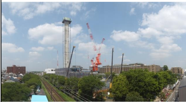
杉並清掃工場(建設工事中)