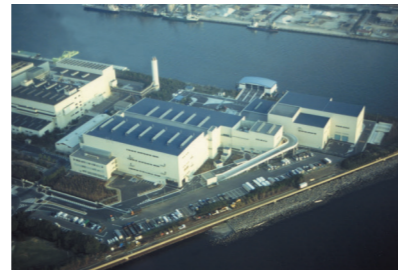
京浜島不燃ごみ処理センター (大田区京浜島)