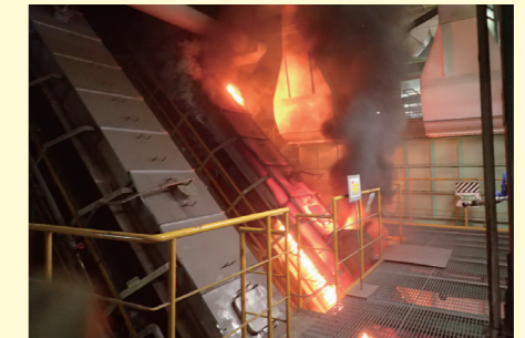
リチウムイオン二次電池によるコンベヤ火災 (中防不燃ごみ処理センター)

※下図に示す選別の流れは概略です。要所ごとに磁選機・アルミ選別機などが複数あります。