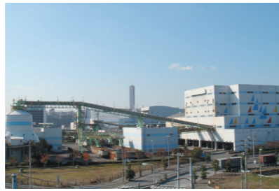
中防不燃ごみ処理センター (江東区海の森)

不燃ごみは、不燃ごみ処理センター（2施設）で処理します。不燃ごみの処理には、大きく分けて破碎と選別があります。不燃ごみは、始めに細かく砕いて容積を小さくします。次に、不燃ごみの中に含まれている鉄やアルミニウムは資源物として回収し、不燃物は埋立処分します。残ったその他ごみは、清掃工場で焼却処理します。