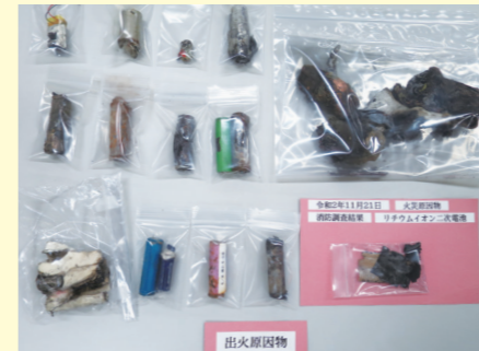
火災の原因となった二次電池

コードレス掃除機やモバイルバッテリーなど二次電池を内蔵する小型家電等を不燃ごみや粗大ごみとして出す場合には、事前に二次電池(バッテリー)を取り外すなど、各区で決められた方法に従ってください。近年、小型家電等に内蔵された二次電池の火災が増加しており、ごみ収集車や設備が焼損しています。設備が焼損すると、修理費用が発生するだけでなく、23区の不燃ごみや粗大ごみを処理できなくなります。