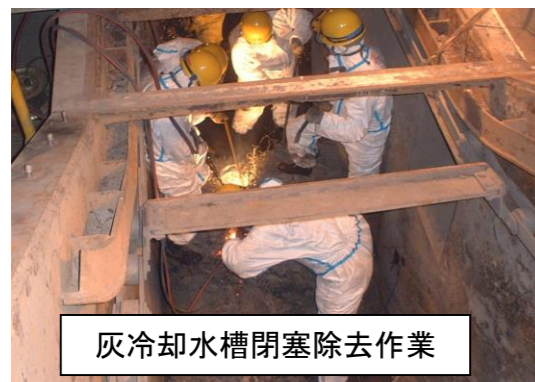
灰冷却水槽閉塞除去作業