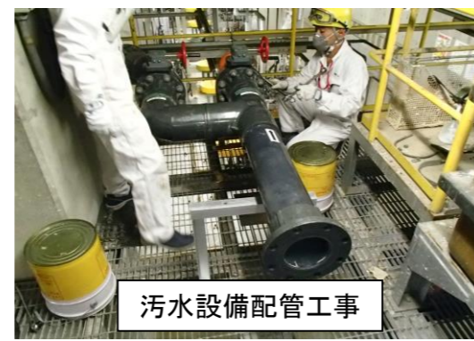
汚水設備配管工事