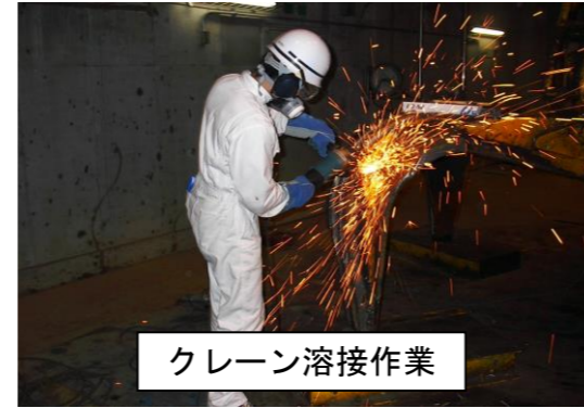
クレーン溶接作業