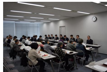
意見交換会の様子

今回は、「平成29年度予算のあらまし」「清掃一組の放射能対策について」をテーマに、区民の皆様15名の参加がありました。