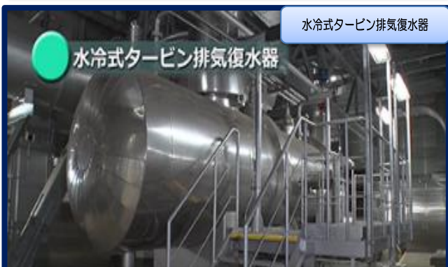
水冷式タービン排気復水器

発電で利用した蒸気を冷やして水に戻し、その時に交換した熱を温水として熱供給事業者に供給します。