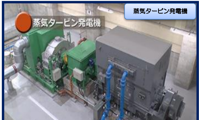
蒸気タービン発電機