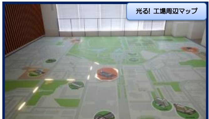
光る! 工場周辺マップ

発電で利用した蒸気を冷やして水に戻し、その時に交換した熱を温水として熱供給事業者に供給します。