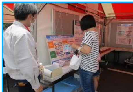
江東区「第15回江東区環境フェア」への出展の様子

23区の環境関連のイベントに出展し、SDGsの取組と身近な私たちの生活がどのように繋がっているかをごみの問題や国際協力事業と関連付けて紹介しています。