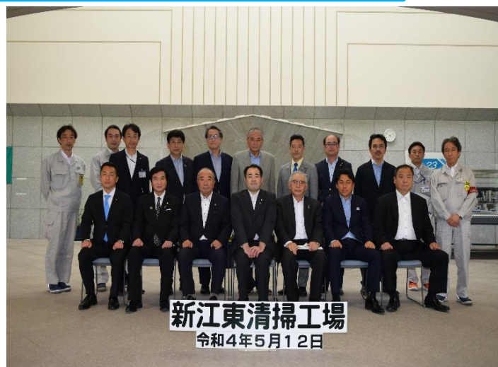
清掃一組議員【清掃工場エントランス】

次に、新江東清掃工場では施設の概要について説明を受け、その後、中央制御室、焼却炉などを、訓練センターでは、危険体験装置を視察しました。