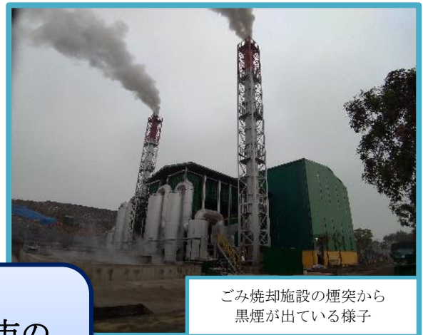
ごみ焼却施設の煙突から 黒煙が出ている様子