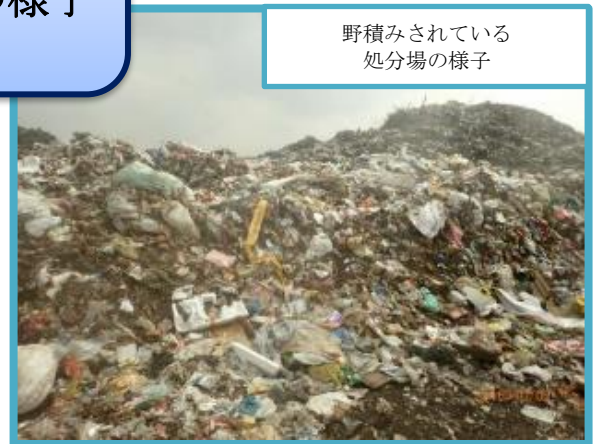
野積みされている 処分場の様子

また、SDGsの推進や海洋プラスチック問題、脱炭素社会の実現に向けた取組の推進などの国際的潮流の中では、一人ひとりが持続可能な開発目標のために行動を起こしていくことが求められています。