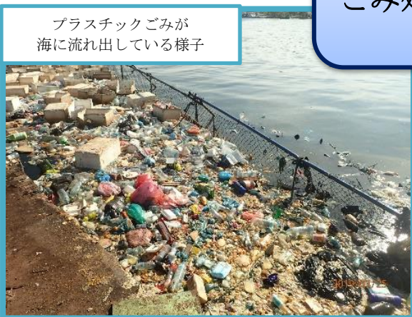
プラスチックごみが 海に流れ出している様子