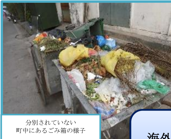
分別されていない 町中にあるごみ箱の様子

海外諸都市は、ごみの不法投棄や不衛生な埋立処分など廃棄物処理に関する様々な課題を抱えており、ごみの分別、収集・運搬や処理施設の建設についての助言など幅広い分野での協力を23区及び清掃一組に求めています。